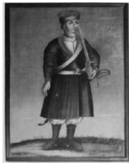
Фото 3. Зображення козаків та міщанина з колишньої “Галаганівської” колекції (власність Чернігівського історичного музею імені В. Тарновського)