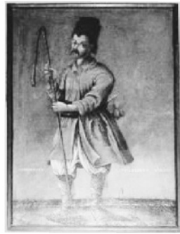
Фото 2. Зображення селян з колишньої “Галаганівської” колекції