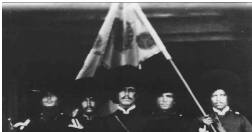
Рис. 8 Козаки Дунайського козацького війська з прапором. 1856 р.