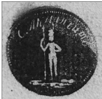
Рис. 6. Печатка козаків с. Акманçит. 1828 р.