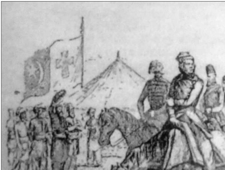
Рис. 4. Прапор задунайських козаків полку М. Чайковського. 1853 р.