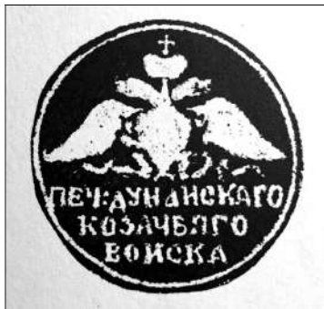
Рис. 7. Печатка Дунайського козацького війська. 1851 р.