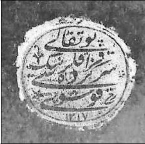
Рис. 1. Запорозьких козаків головний кошовий